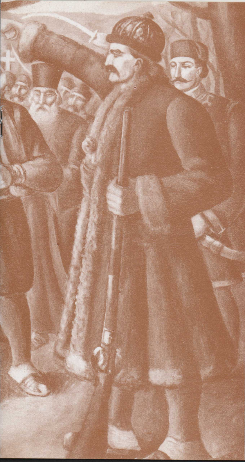
Устанак Вожда Карађорђа у Орашцу, фебруара 1804. год.