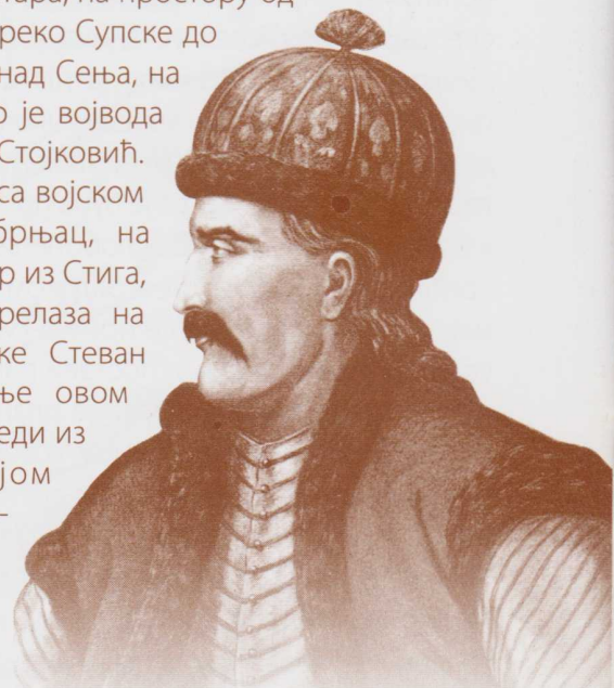
Војвода Миленко Стојковић