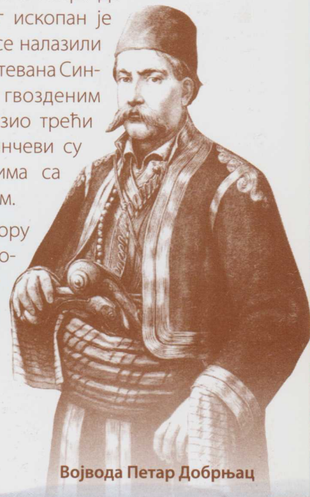
Војвода Петар Добрњац

Турска војска је у зору 18. августа у неколико колона кренула са Везировог брда преко