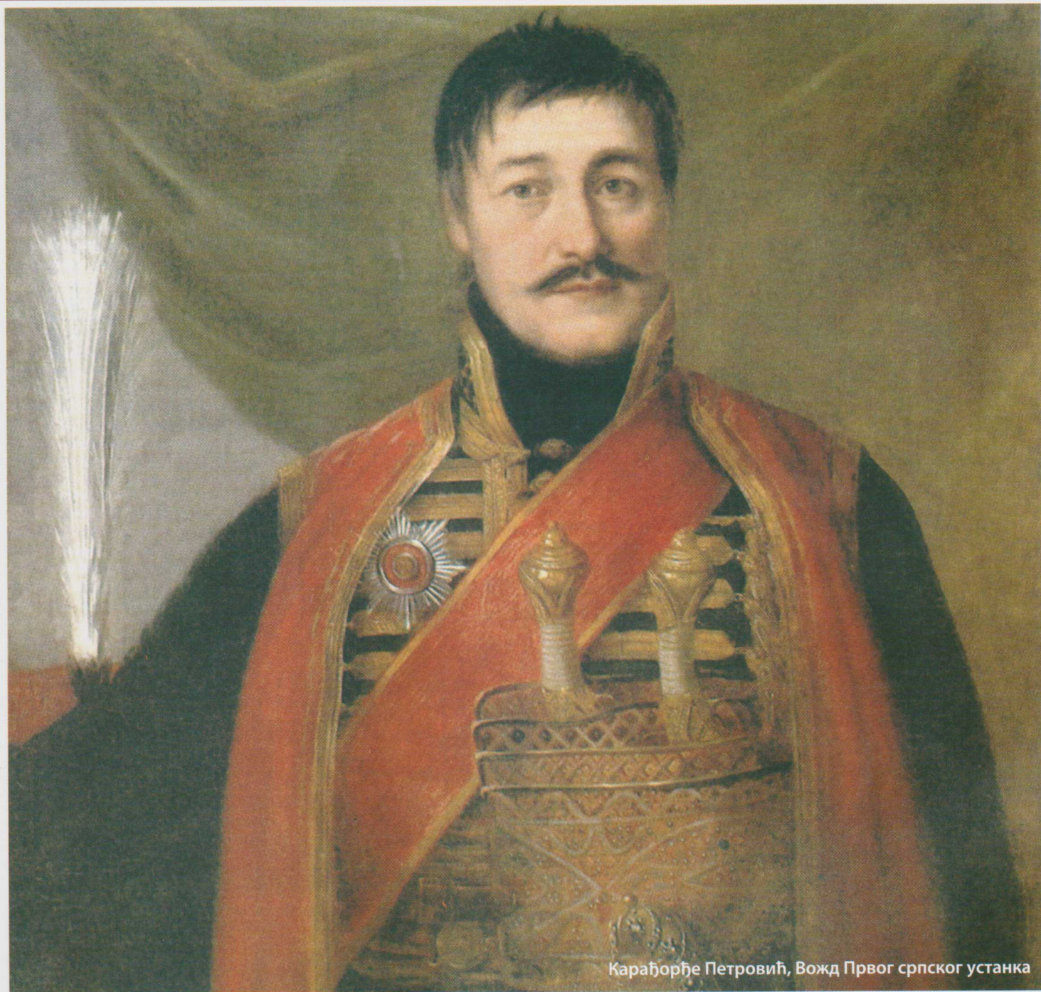
Карађорђе Петровић, Вожд Првог српског устанка