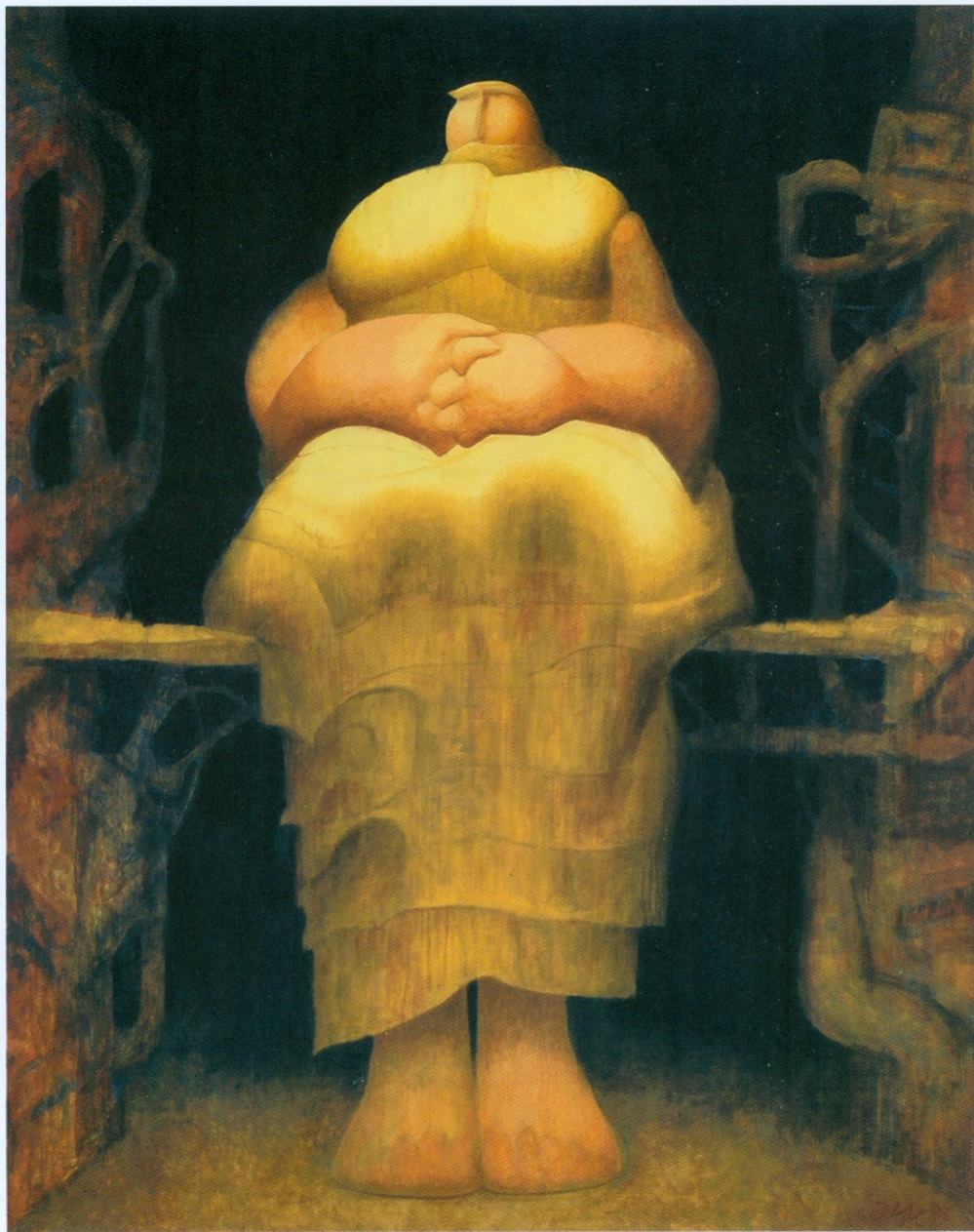
ХЕСТИЈА комбин. техника на платну 61x50 cm 1997.