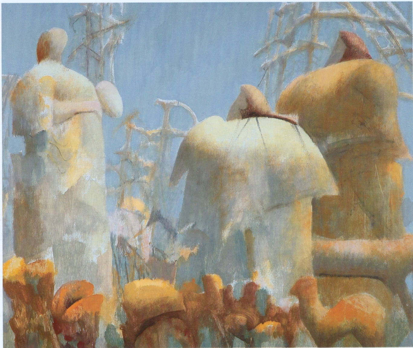
СТАРО СВЕТИЛИШТЕ комбин. техника на платну 65x81 см 2005.