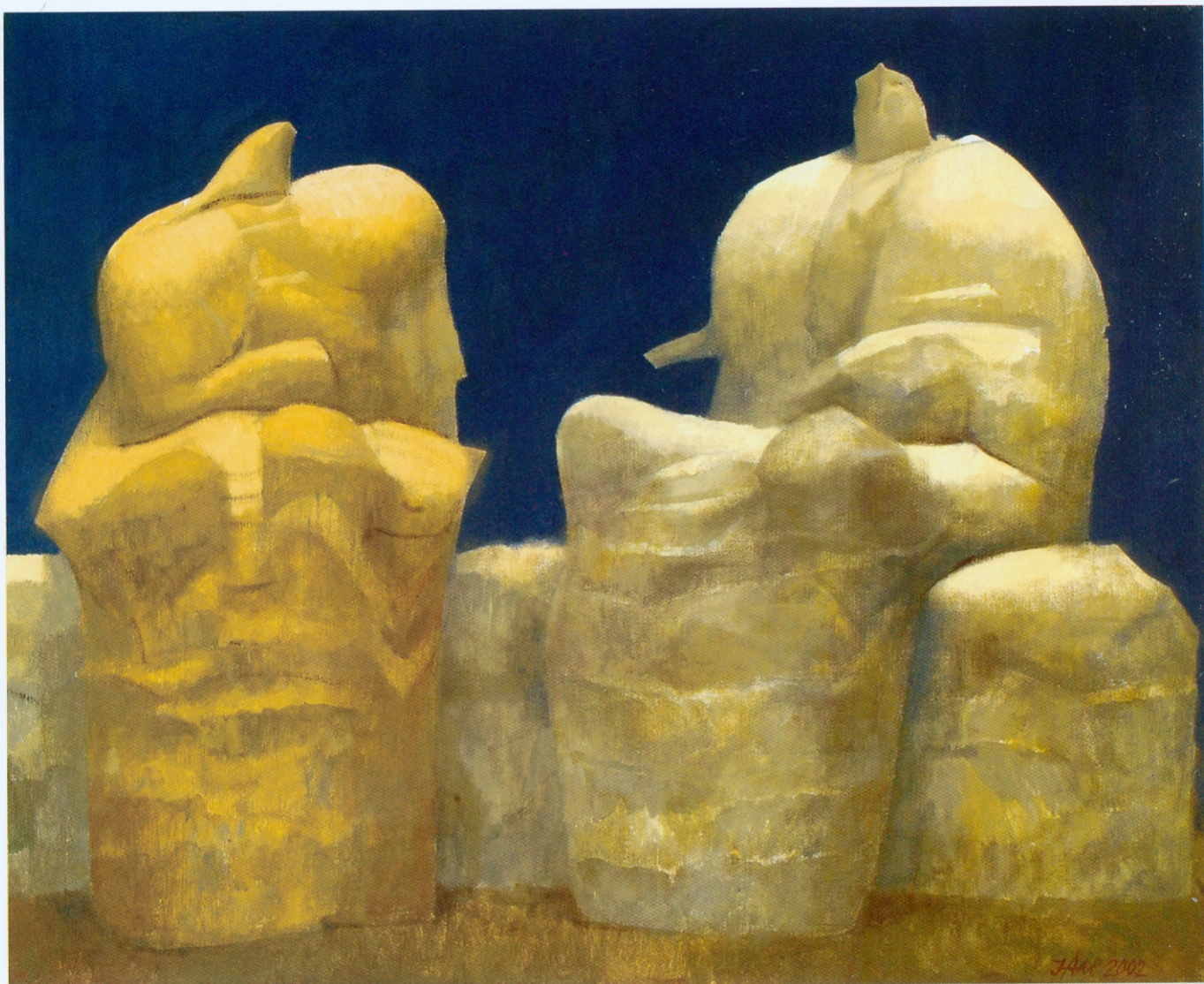
ФЕЛЕМОН И БАУКИДА комбин. техника на платну 65x81 см 2002.