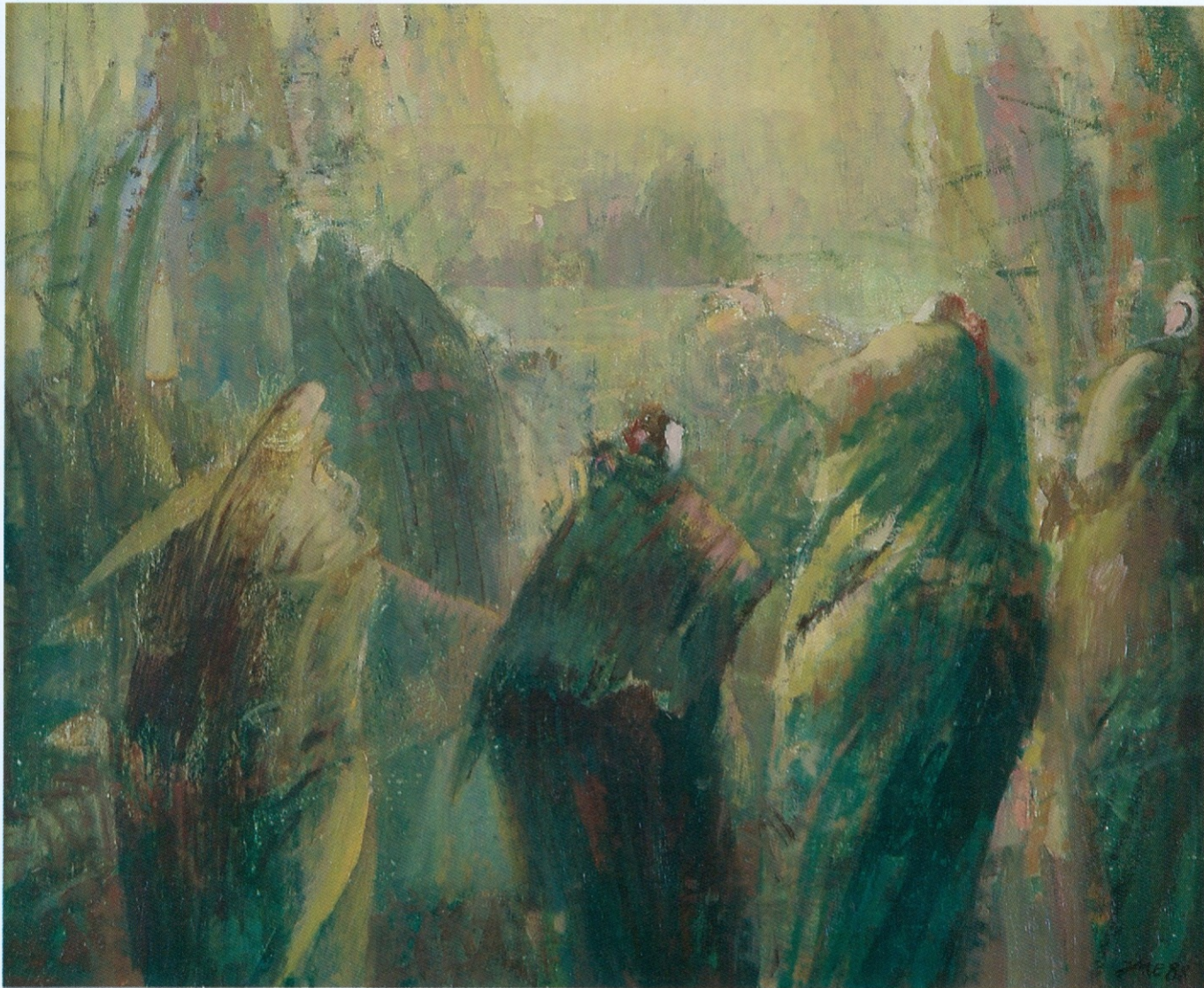
ТРАГАЊЕ уље на платну 50x61 cm 1988.