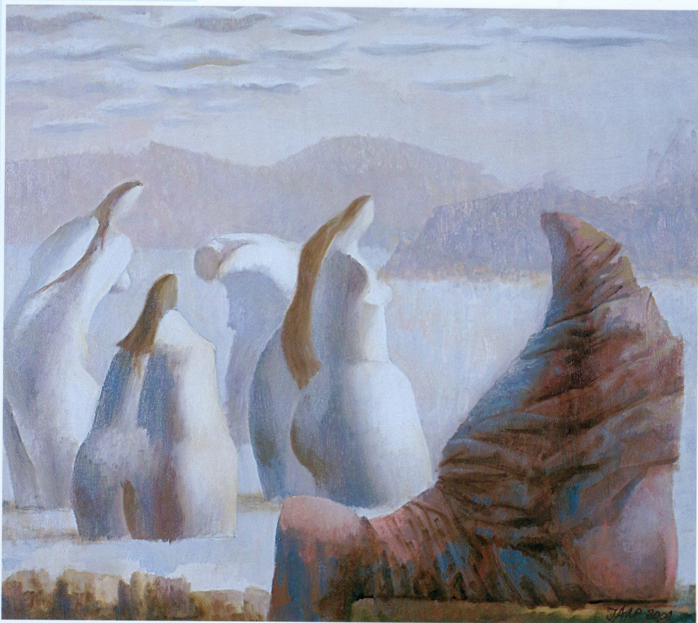
ЛЕТО уље на платну 54x65 cm 2001.