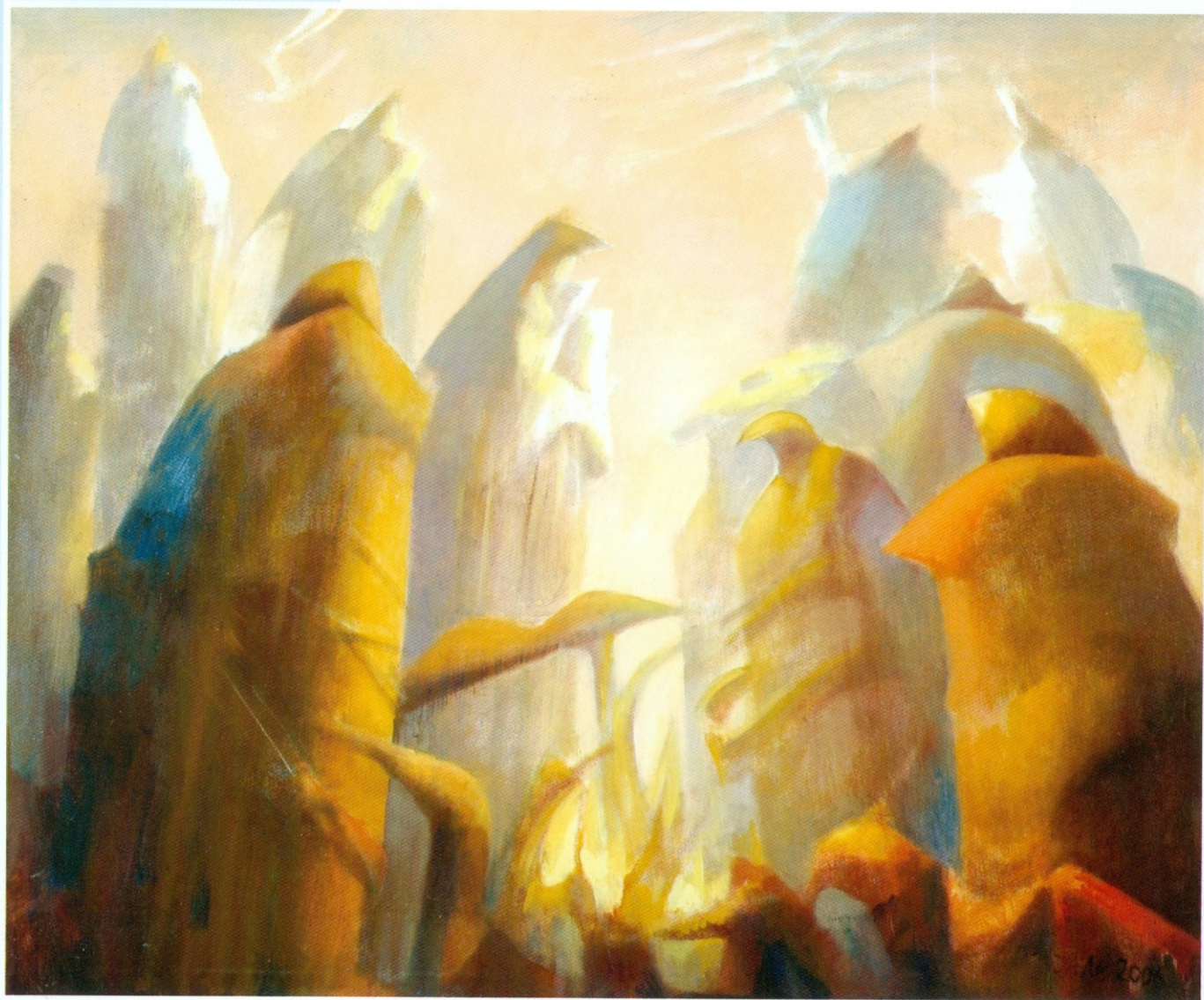
НОВО СТАНИШТЕ комбин. техника на платну 60x73 cm 2006.