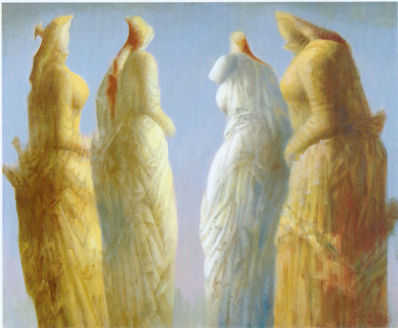
ОБАЛА комбин. техника на платну 60x73 см 2004.