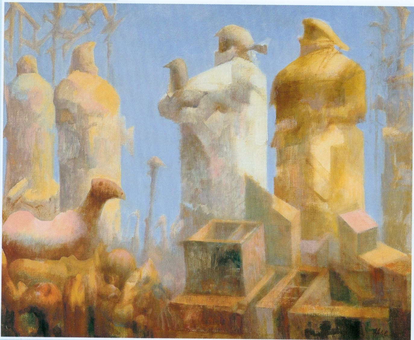
ОБРЕДНО КУПАЊЕ комбин. техника на платну 60x73 cm