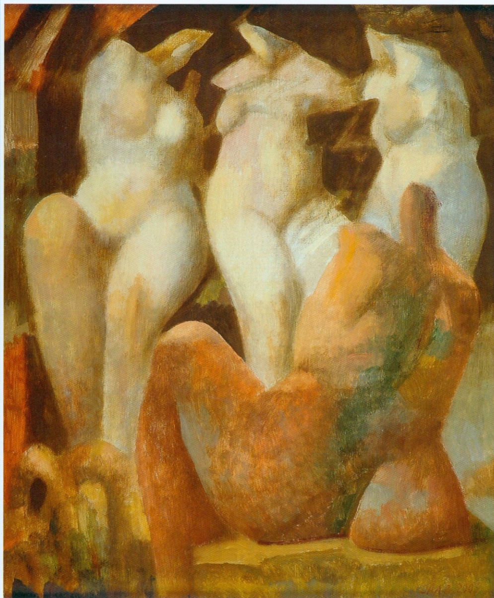
КУПАЛИШТЕ комбин. техника на платну 55x46 cm 2003.