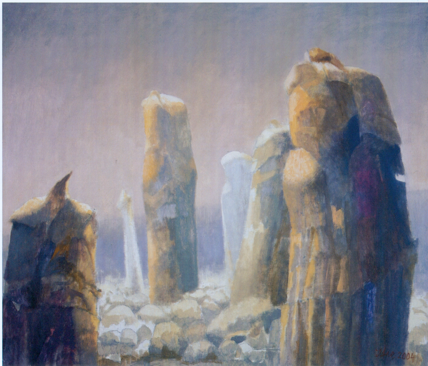
ПРЕПУШТАЊЕ комбин. техника на платну 92x72,5 см