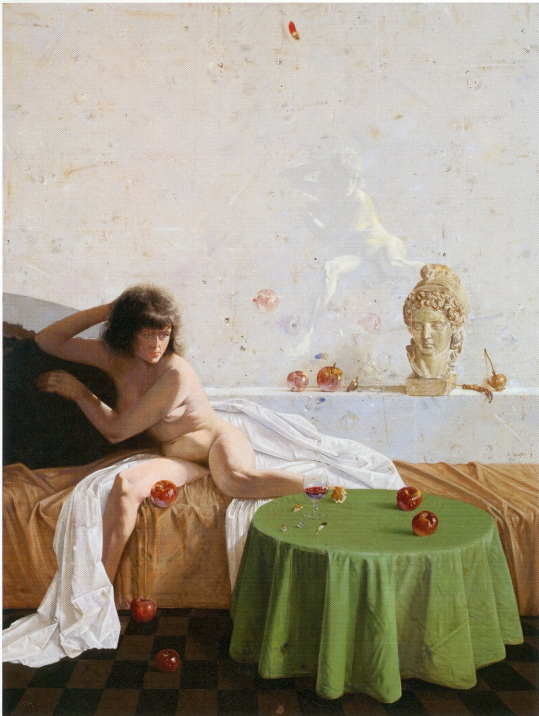
Девојка са јабукама