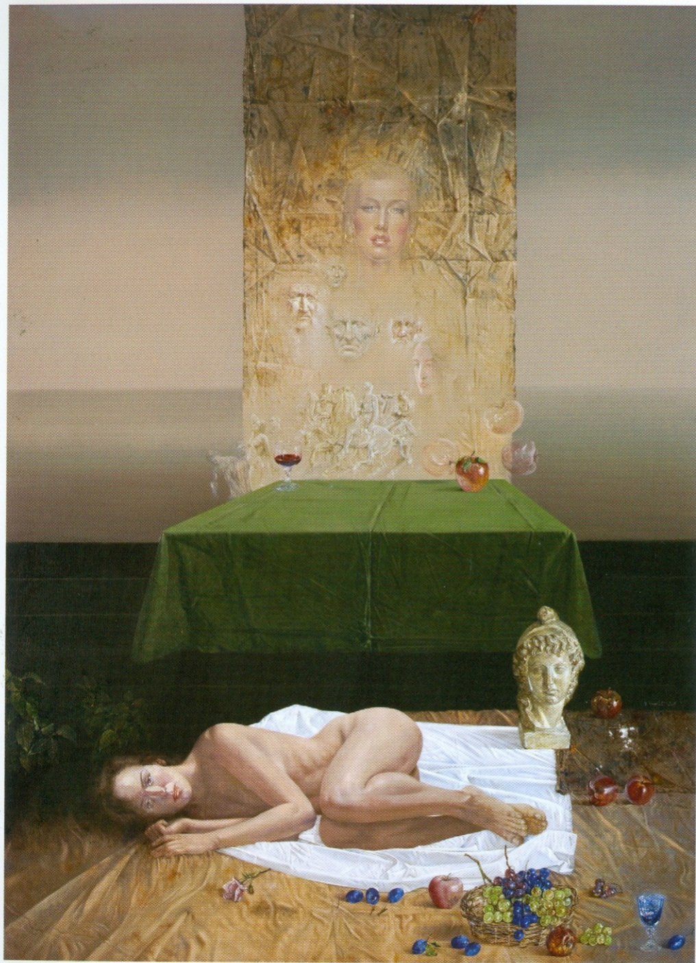
Саламба сања Картагину