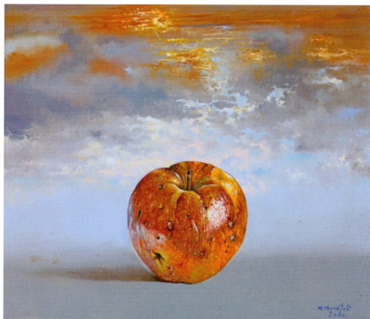
Мала слика са јабуком