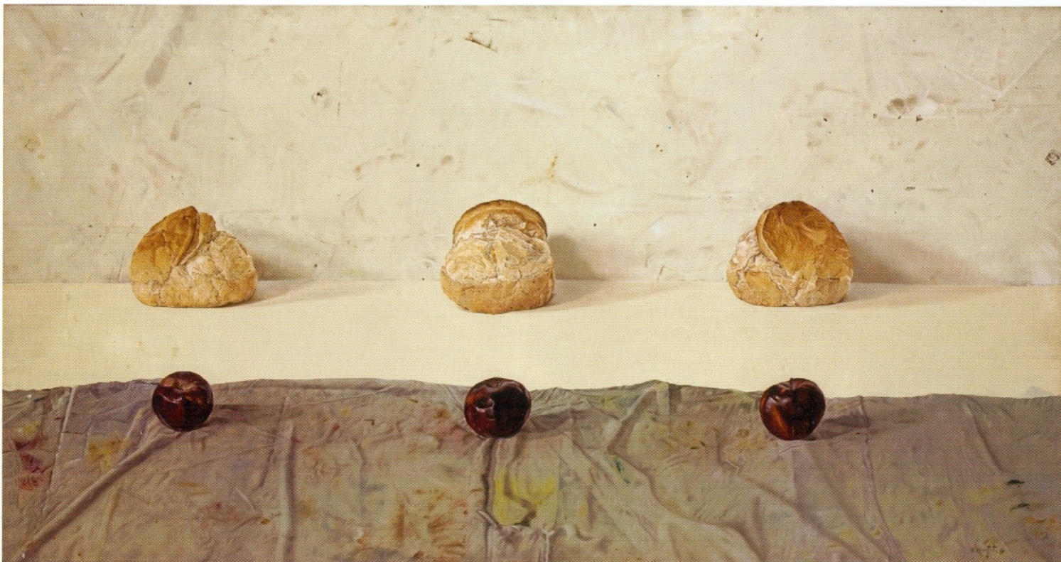
Јабуре и хлебови