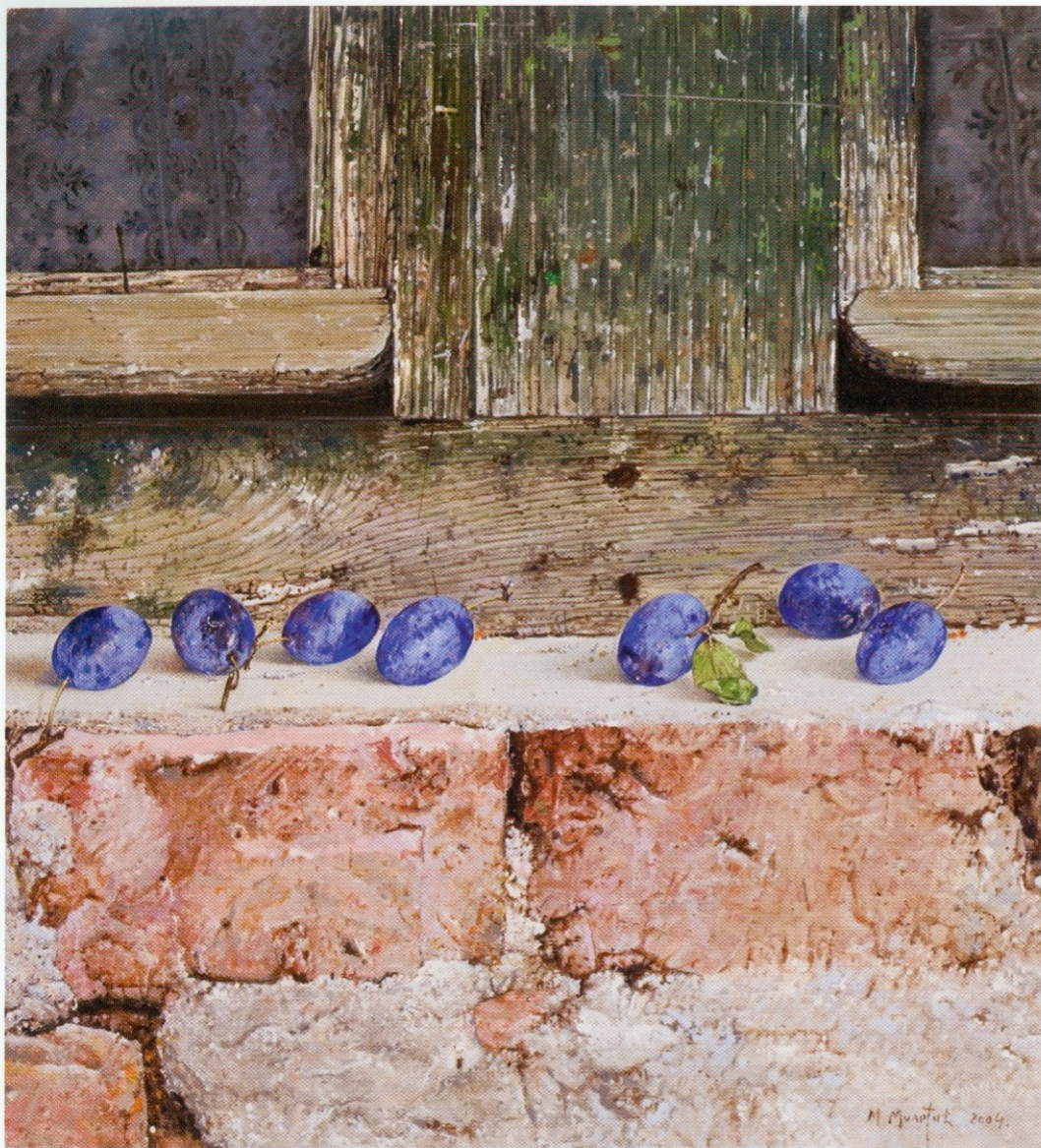
Мала мртва природа на прозору