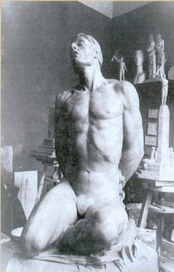
МОДЕЛ „ РОБА“ у глини за споменик у Јагодини, изглед атељеа Ф.М.Динчић у Цетињској улици 8 у Београду