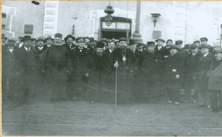
ДОЧЕК ПАТРИЈАРХА ВАРНАВЕ