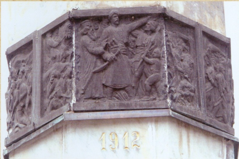
ДРУГИ СРПСКИ УСТАНАК 1815. јужна страна (рељеф грешком потписан годином 1912)