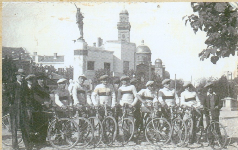
БИЦИКЛИСТИЧКИ КЛУБ ЈАГОДИНЕ 1932. ГОДИНЕ