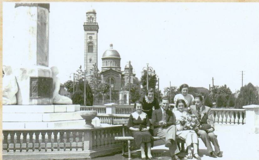
ЈАГОДИНЦИ НА СКВЕРУ, 1935. ГОДИНЕ