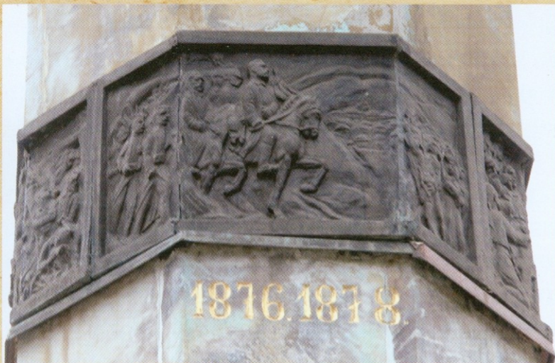
ПРВИ БАЛКАНСКИ РАТ 1912 источна страна (рељеф грешком потписан годинама 1876-1878.)