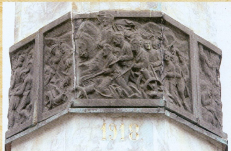
ПРВИ СВЕТСКИ РАТ СА УКЛЕСАНОМ 1918. ГОДИНОМ западна страна

До пермутовања рељефних плоча дошло је током радова на њиховом постављању. Видети Б. Цватковић, Српска скуптура новијег доба и јавни споменици у Јагодина (I), Корени VII, Јагодина 2008, 56