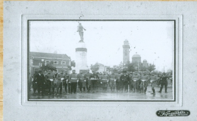
ОФИЦИРСКИ КОР НА ОТКРИВАЊУ СПОМЕНИКА