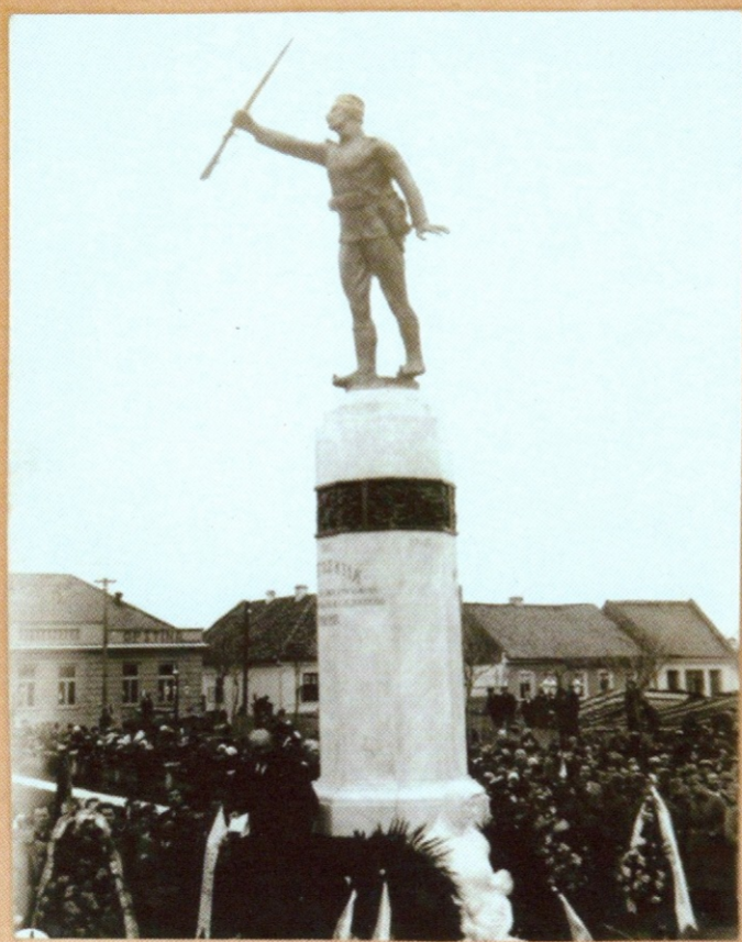
Поменик на падених војинама 1912-1918г. оцетеним 7. јуна 1930г.