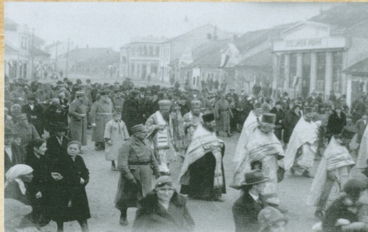
ЛИТИЈА КРОЗ ЈАГОДИНУ