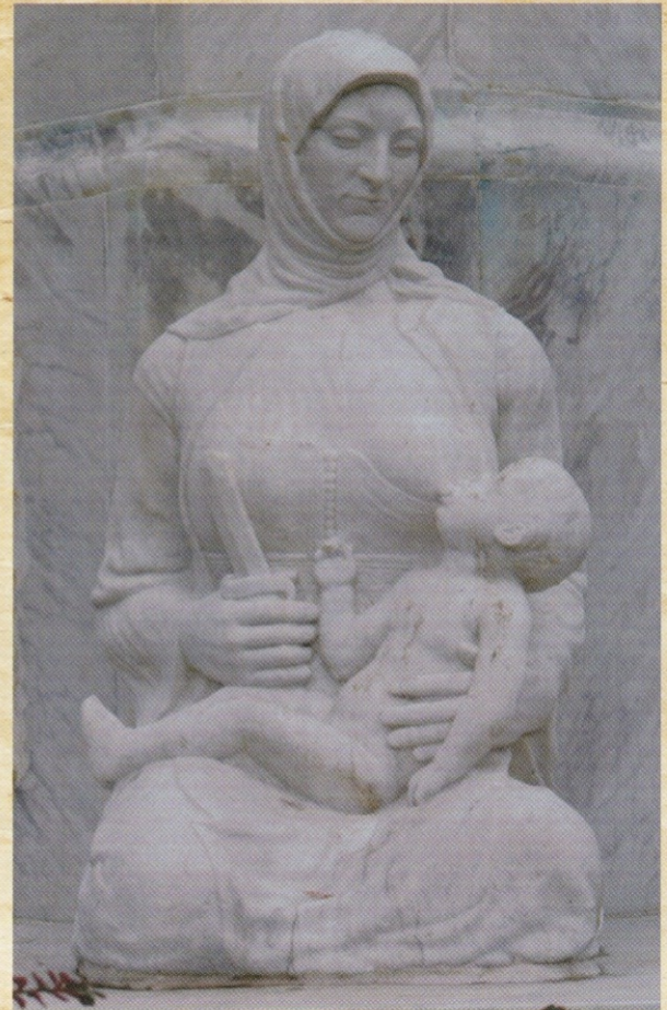
ФИГУРА МАЈКЕ С ДЕТЕТОМ У НАРУЧЈУ западна страна споменика