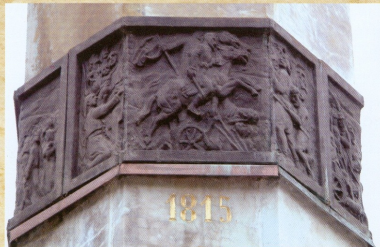
СРПСКО ТУРСКИ РАТ ЗА ОСЛОБОЂЕЊЕ НИША, ПИРОТА И ВРАЊА 1876-1878. северна страна (рељеф грешком потписан годином 1815.)