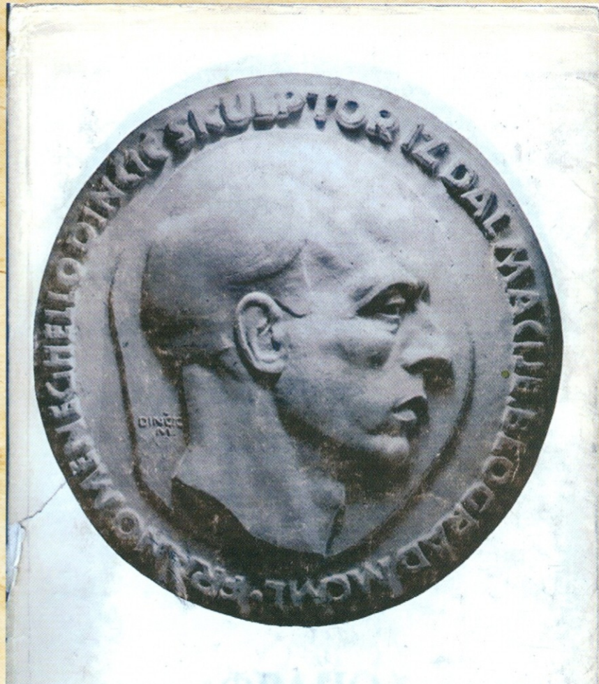
АУТОПОРТРЕТ УМЕТНИКА гипс, 1950.