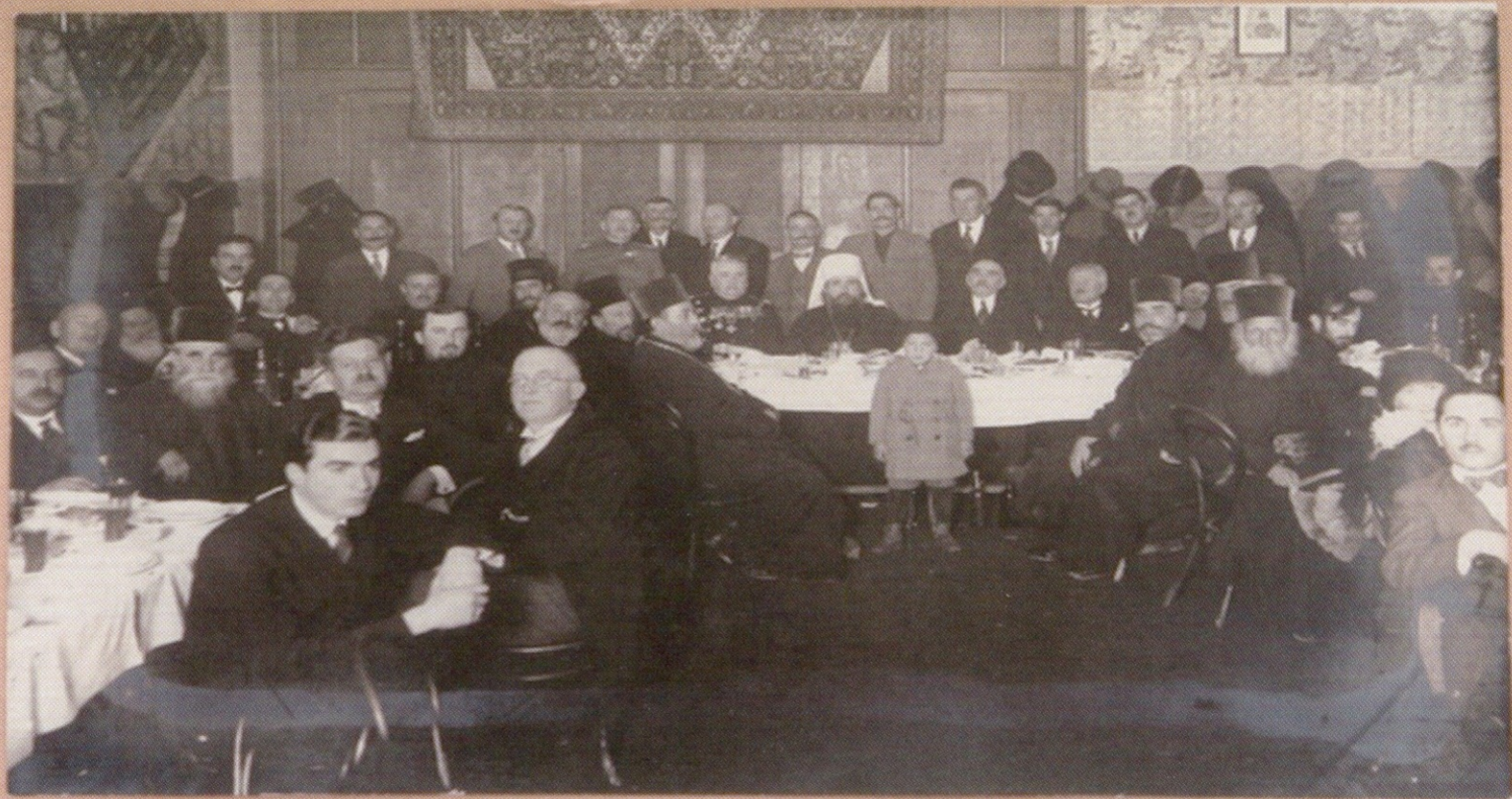
Банкет 7 декембар 1930 г. на осветение евангелиа