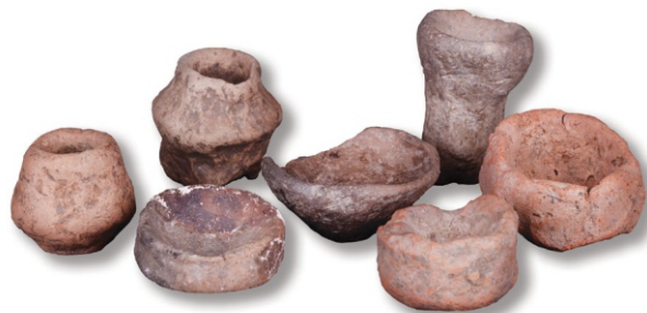
Сл. 1: минијатурне посуде играчке, од којих су неке направила деца

Антропоморфне (сл. 2) и зооморфне фигурине (сл.3) стилизоване и сведених форми, малих димензија и несавршено моделоване, које имитирају предмете култне намене, који својим обликом и начином израде показују могућност другачије функције од оне култне или декоративне, 10 претпоставља се да припадају групи играчака. Луткице које представљају