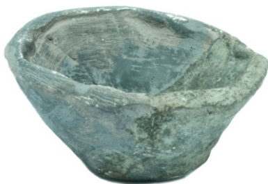
Сл. 5: минијатурна здела неолит, Ромулијана

Све ово говори у прилог мишљењу да је имитирање живота одраслих феномен који можемо сматрати универзалном децом играчком. Игра глином, тј. моделовање, осим забаве имала је и едукативни карактер. Деца су се, наиме, подучавала једној вештини која ће им бити неопходна када одрасту, а то је била израда керамичког посуђа и других предмета од глине. Учење кроз игру најлепши је вид учења, а минијатурне керамичке посуде у исти мах су и играчке и средство за учење, начин припреме за живот у свету одраслих.