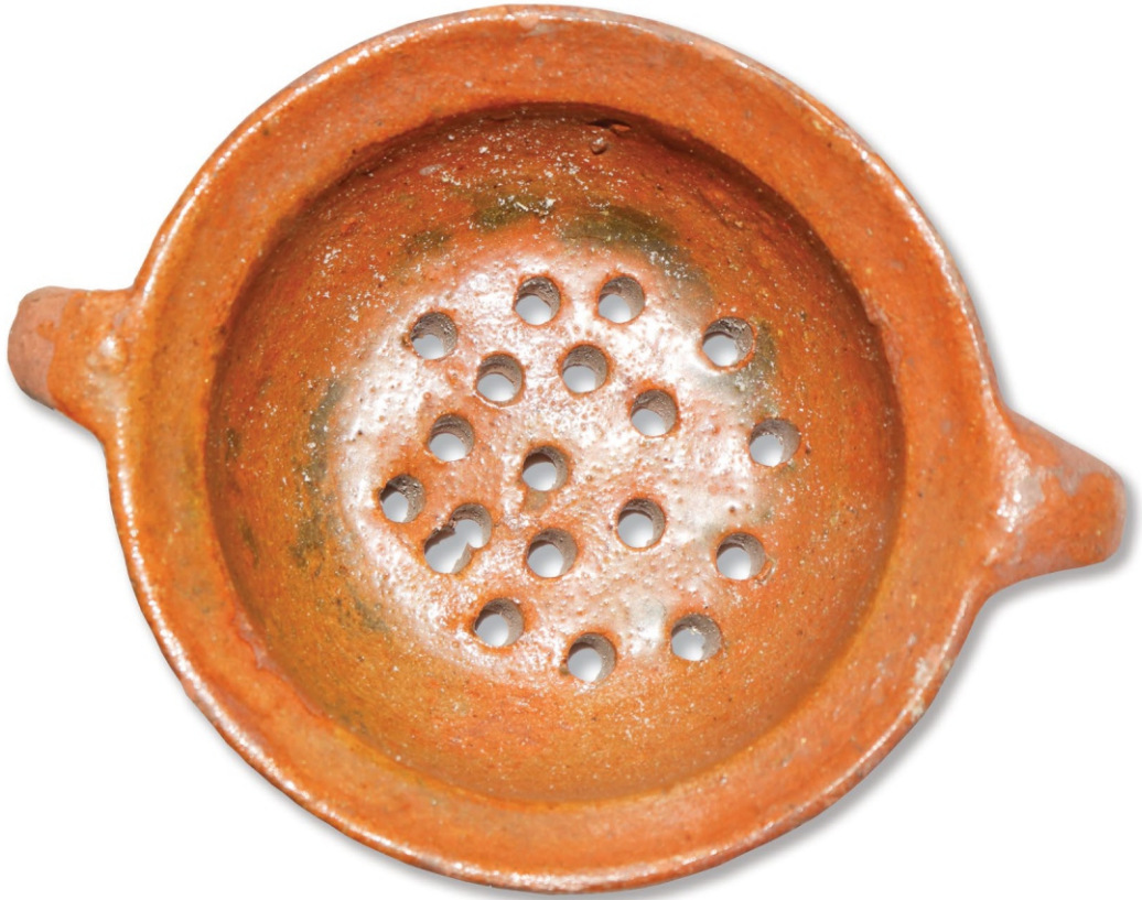
Цедиљка (ђевђир)-дечија играчка НМП ЕЗ, инв. бр. 844