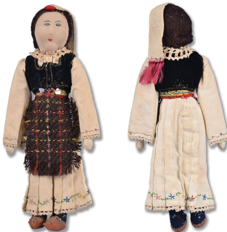
Сл. 5: лутка, ручни рад Радмиле Рајковић

...Покашћу ти писмена из мога буквара, учићу те како се српски разговара.“