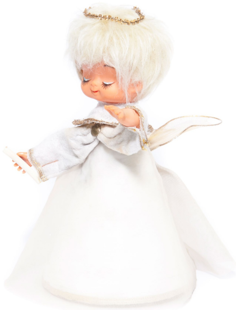
Лутка-анђео, XX век (приватна колекција)