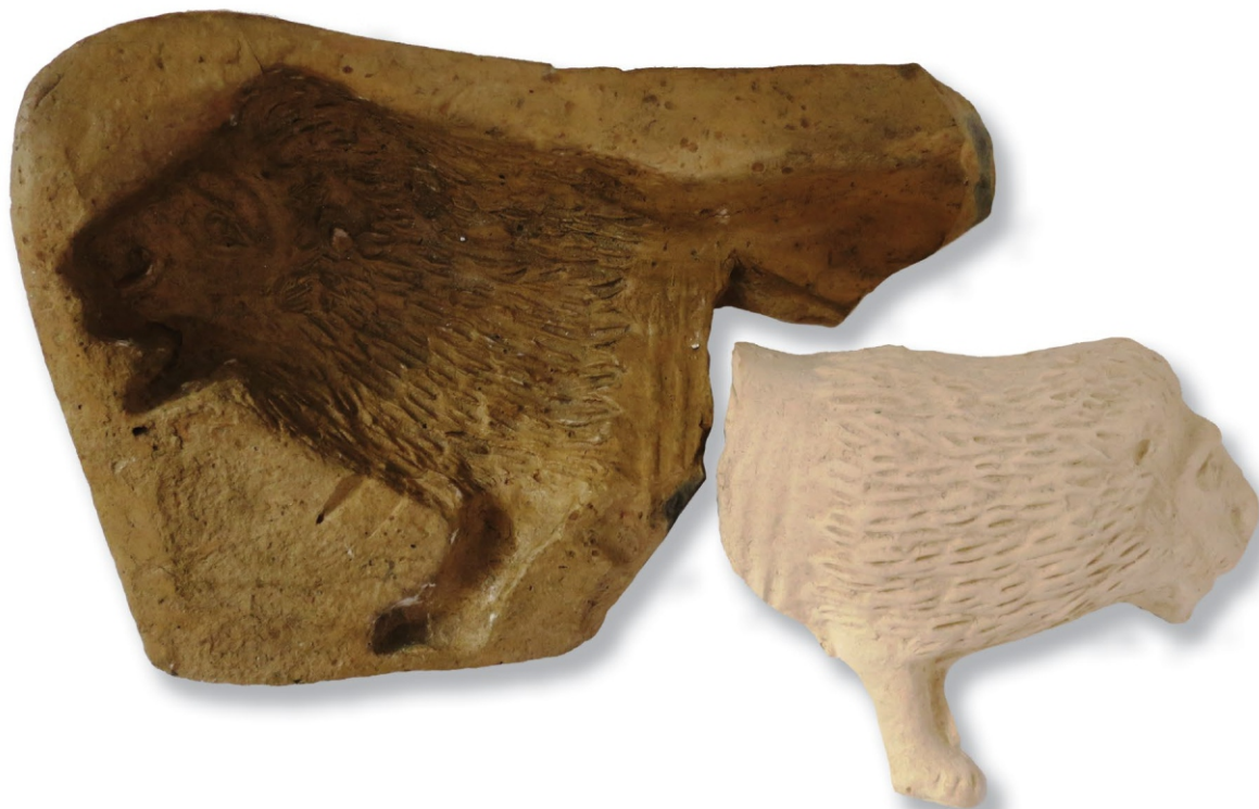
Фигурица лава, калуп, II век Костолац-Виминацијум, лок. Више гробаља НМП. 03/2290