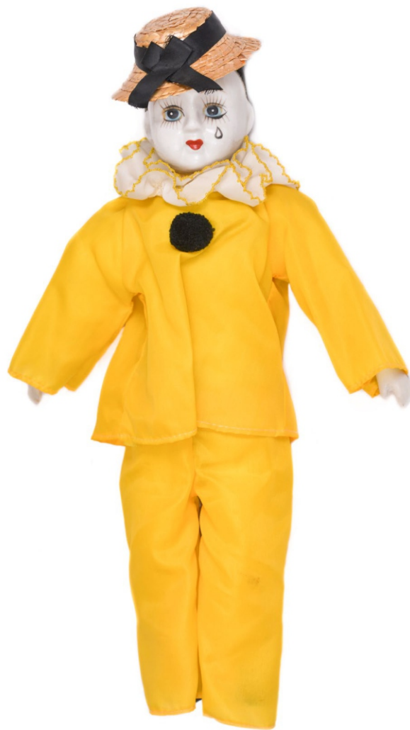
лутка-клоун Арлекино, XX век ЗМК Е3346