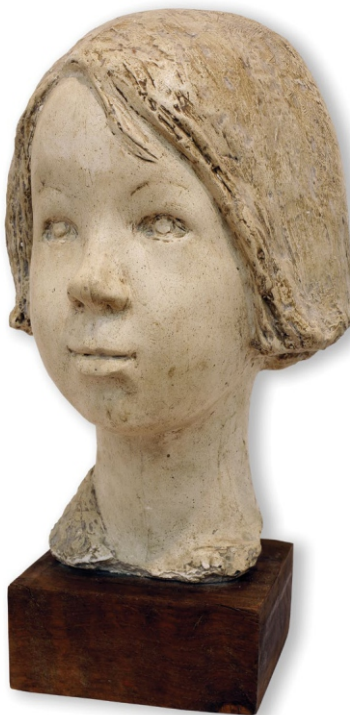
Девојчица, Инв. бр. 543