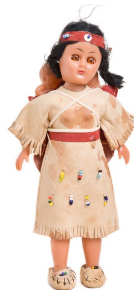
Сл. 4: лутка-индијанка, XX век ЗМК Е3329