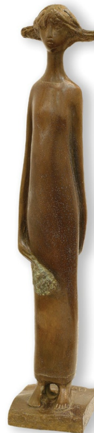
Девојчица са цветом Инв. бр. 634