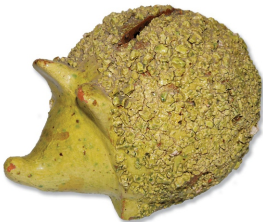
Сл. 4: касица-јеж НМП ЕЗ, инв. бр. 840

Минијатурно посуђе, пиштаљке и касице биле су познате још у антици. Ове форме су се као производи грнчарског заната очувале до шездесетих година XX века, као део традиционалне културе. Савремена култура је донела нове материјале и облике прилагођене савременим условима живота, али су ове врсте играчака и даље део дечјег света и маште које децу васпитавају и образују кроз игру уводећи их у свет који их чека.