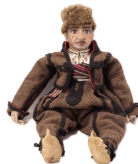
Сл. 2: лутак у народној ношњи, XX век инв.бр. Е 2664

Најстарији предмети у збирци играчака Завичајног музеја Књажевац настали су 30-их година XX века. Реч је о ручно израђеним луткама од папир-машеа, текстила и коже одевеним у народну ношњу књажевачког краја (сл. 1, 2). Занимљиво је да су овакве лутке први пут излагане у јавности 1933. године на изложби поводом стогодишњице ослобођења Књажевца од Турака, 10 а да их је израдила једна припадница мале заједнице руских емиграната у Књажевцу. Играчке из послератног периода, односно из 50-их година XX века у највећој мери чине лутке (бебе, девојчице...)