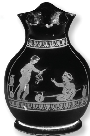
Сл. 3: представа ваљка на атичкој црвено-фигуралној вази (420-410. г.п.н.е.) (према Dasen, 2011, 310, 18. 10)

Судећи по приказима на грчким вазама и римским споменицима, омиљена дечја играчка биле су и двоколице које су деца гурала пред собом. Колица са четири точка,