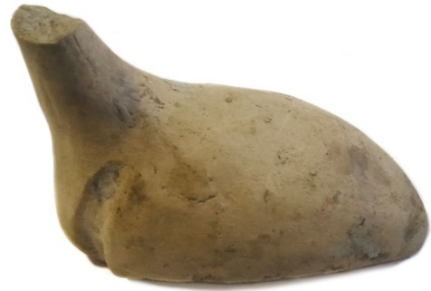
Сл. 4: птица локалитет Сектор VII