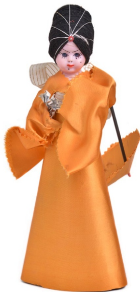
Сл. 3: лутка-јапанка, XX век ЗМК Е3328