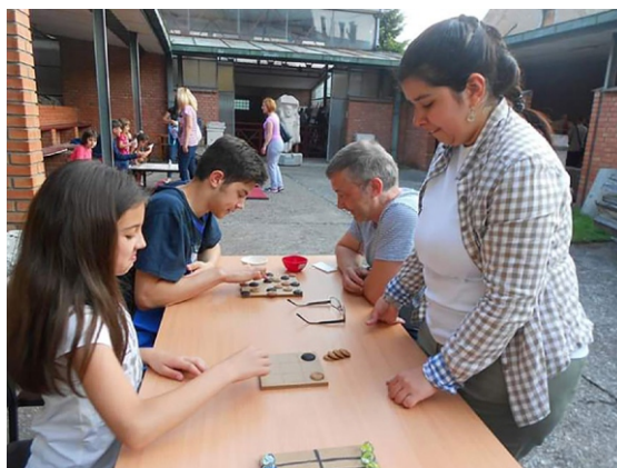
Сл. 9 - Музеј Срема, радионица римске игре, 2018.