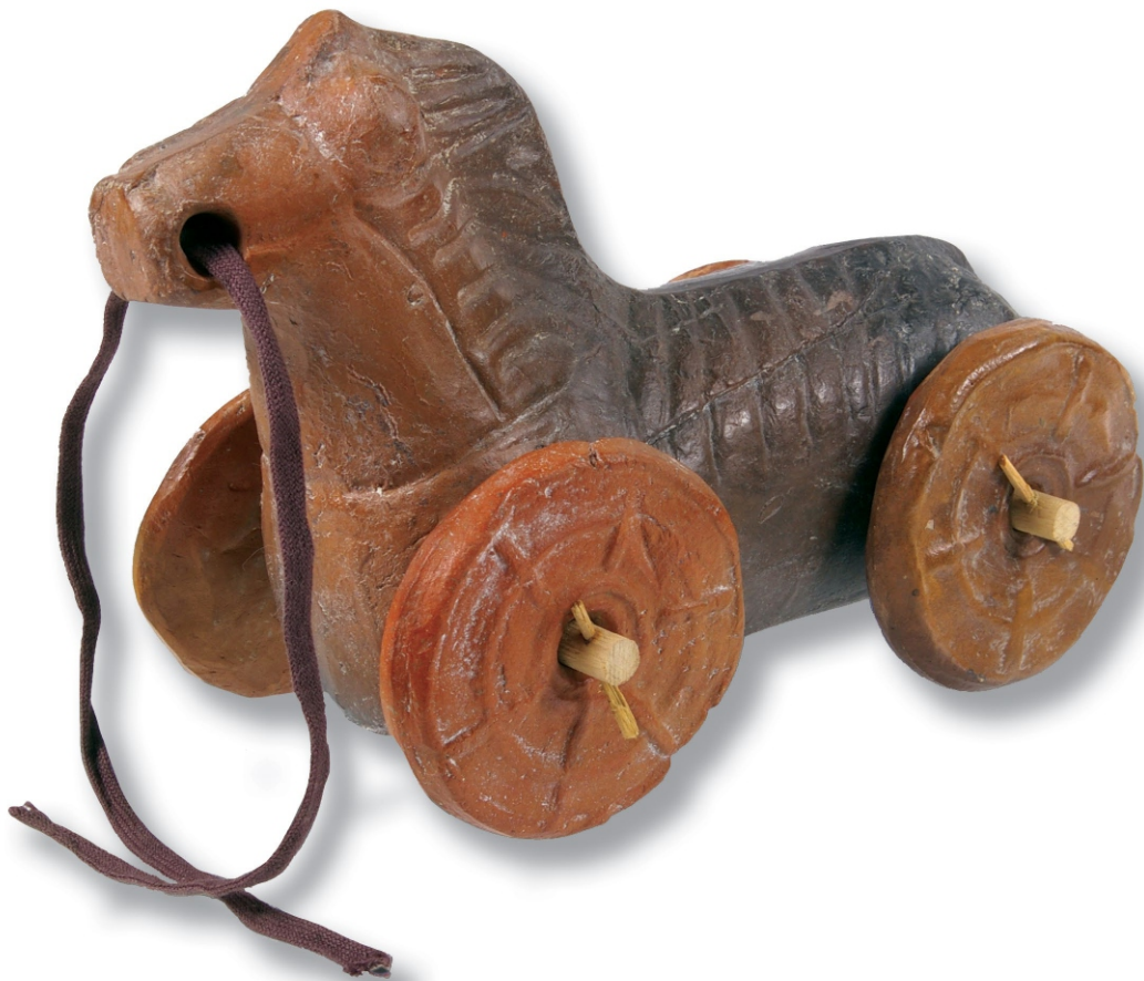
Коњић на точковима, II век Костолац-Виминацијум, лок. Више гробаља НМП 03/3752