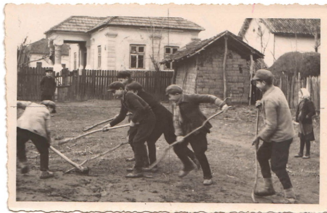
Сл. 1: дечија игра "свињице", Кобишница, XX век

Од праиграчака, првобитних археолошких минијатура из свакодневног живота, преко оних народних из традиционалне културе, израђених руком од различитих материјала и на селу и у граду, до савремених играчака занатске, а касније индустријске израде (на даљинско управљање, све до савремених компјутера)-функција играчке остала је иста. Она обезбеђује најосновније