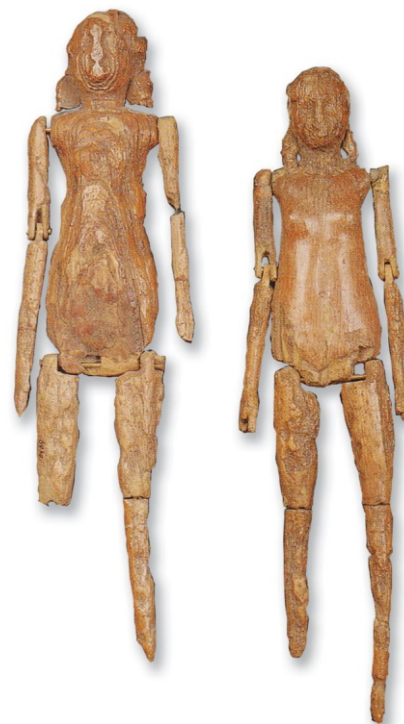
Сл. 2: покретне-зглобне лутке од кости Љубљана, друга половина III века (према Balen-Letunić i Rendić-Miočević 2012, 32, sl. 3)

Из Виминацијума потичу примери статичних и зглобних лутки (кат. 78-80) израђени у виминацијумским керамичарским радионицама. Девојке су пре удаје, у предбрачној ноћи, своје лутке посвећивале различитим женским божанствима, најчешће Артемиди и Афродити, као што су то чинили и дечаци уочи пубертета, симболично се опраштајући од детињства. 15