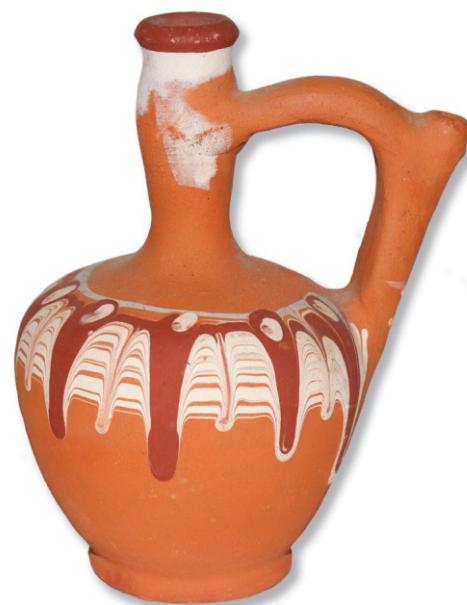
Сл. 1: тестија-дечија играчка НМП ЕЗ, инв. бр. 2640

У етнолошкој збирци Народног музеја у Пожаревцу чувају се следеће минијатурне посуде: тестија (сл. 1), бокал, котлајка и цедиљка (ћевђир). Рађене су на ножном колу. Тестија, бокал и котлајка украшене су белом енгобом и нису глеђосане, док је ћевђир глеђосан безбојном глеђу.