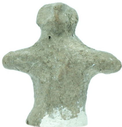
Сл. 2: антропоморфна фигурина неолит (Винча-Плочник)