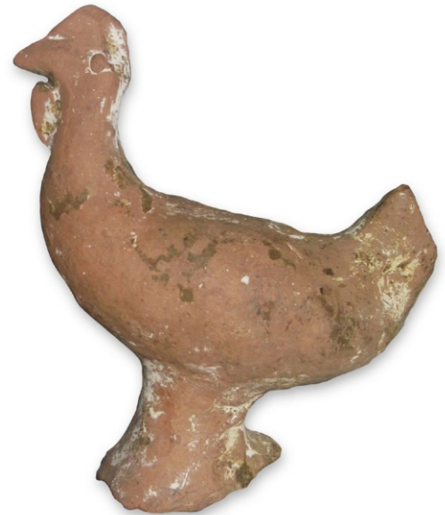
Сл. 3: птица-кокошка, локалитет 42 Сирмијума