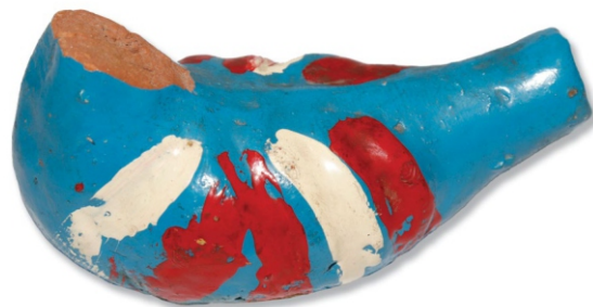
Сл. 3: пиштаљка (птица) НМП ЕЗ, инв. бр. 851

Пиштаљке су се израђивале најчешће у виду судића и фигурица: тестијца, вазница, птица (сл. 3), пловки, коњића, патуљака. 6 У етнолошкој збирци Народног музеја у Пожаревцу налазе се две пиштаљке. Једна је у облику птице, а друга патке, израђене почетком шездесетих година XX века. Произвођење различитих врста звукова је у свим временима и на свим просторима био саставни део одрастања. У најранијем детињству у ту сврху су коришћене звечке, а касније пиштаљке. Оне су биле добра забава деци.