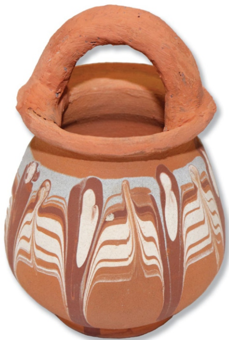
Сл. 2: котлајка-дечија играчка НМП ЕЗ, инв. бр. 2638