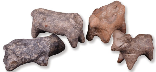
Сл. 3: зооморфне фигуристине винчанске културе

људе су вероватно израђиване од различитих природних материјала-сламе, коже, дрвета, али има и керамичких, које су веома стилизоване (кат. бр. 1, 3, 29, 32-35), невешто израђене (кат. бр. 28.), некад направљене дечјом руком (кат. бр. 2, 4.).