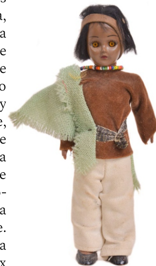
Сл. 5: лутак-индијанац, XX век ЗМК Е3330