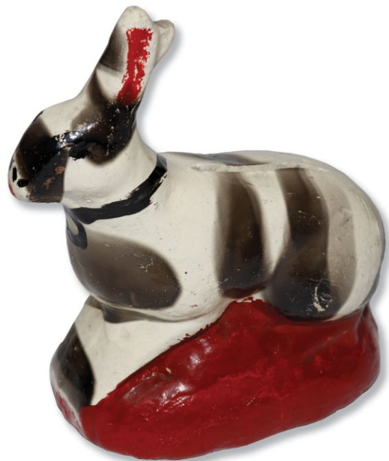
Сл. 3: касица-зец НМП ЕЗ, инв. бр. 842