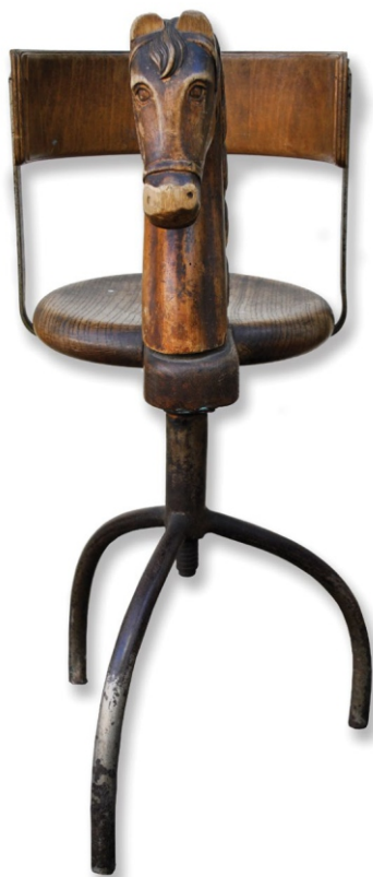
Сл. 3: Дрвени коњић, XX век МКН, инв. бр. 48