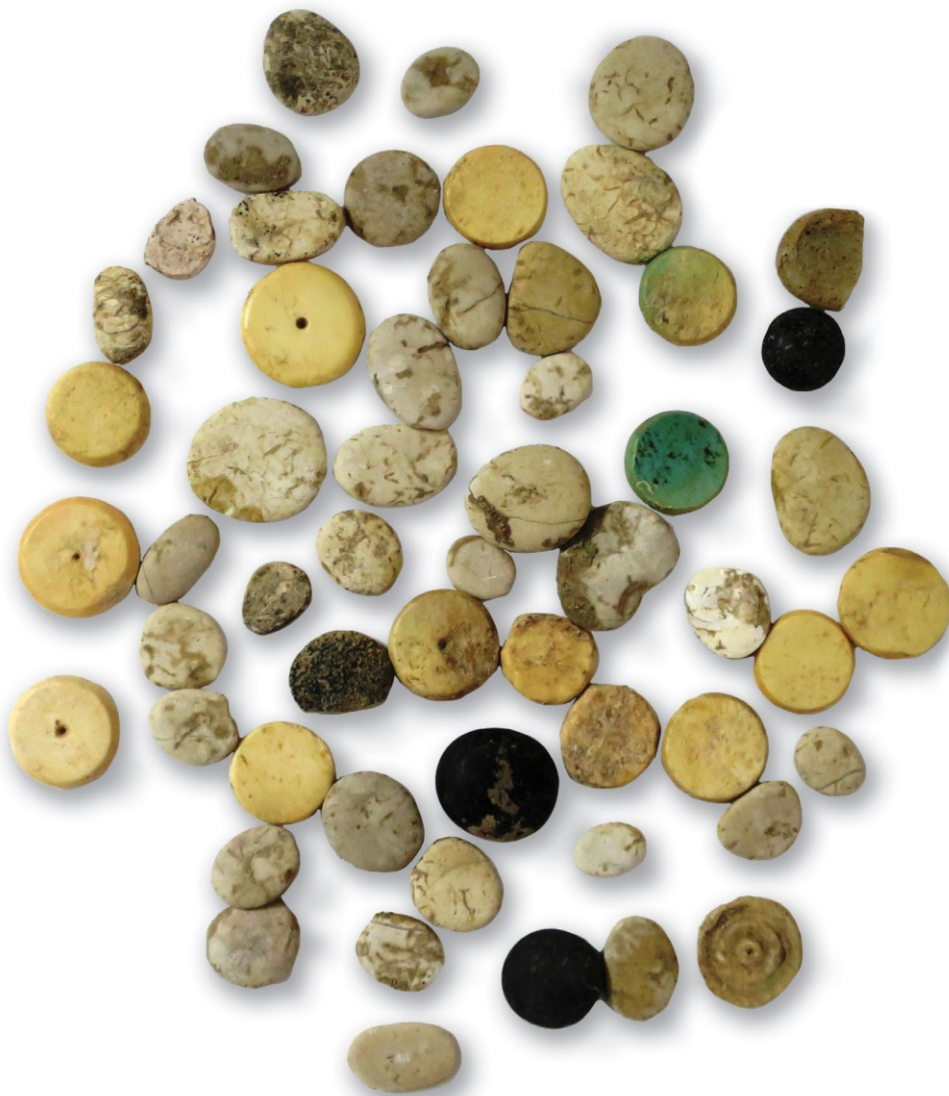
Жетони (59 ком.), II-III век Костолац-Виминацијум, лок. Пећине, НМП. 03/4038