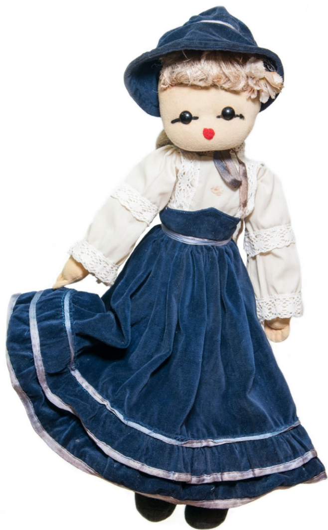
Лутка, XX век (из приватне колекције)