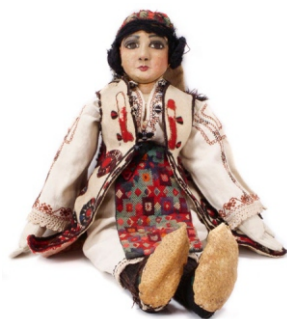
Сл. 1: лутка у народној ношњи, XX век, инв.бр. Е 2669