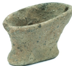
Сл. 6: минијатурна посуда са стопом неолит непознато, налазиште