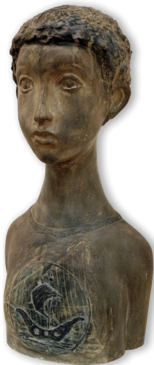
Дечак у мајици Инв. бр. 597