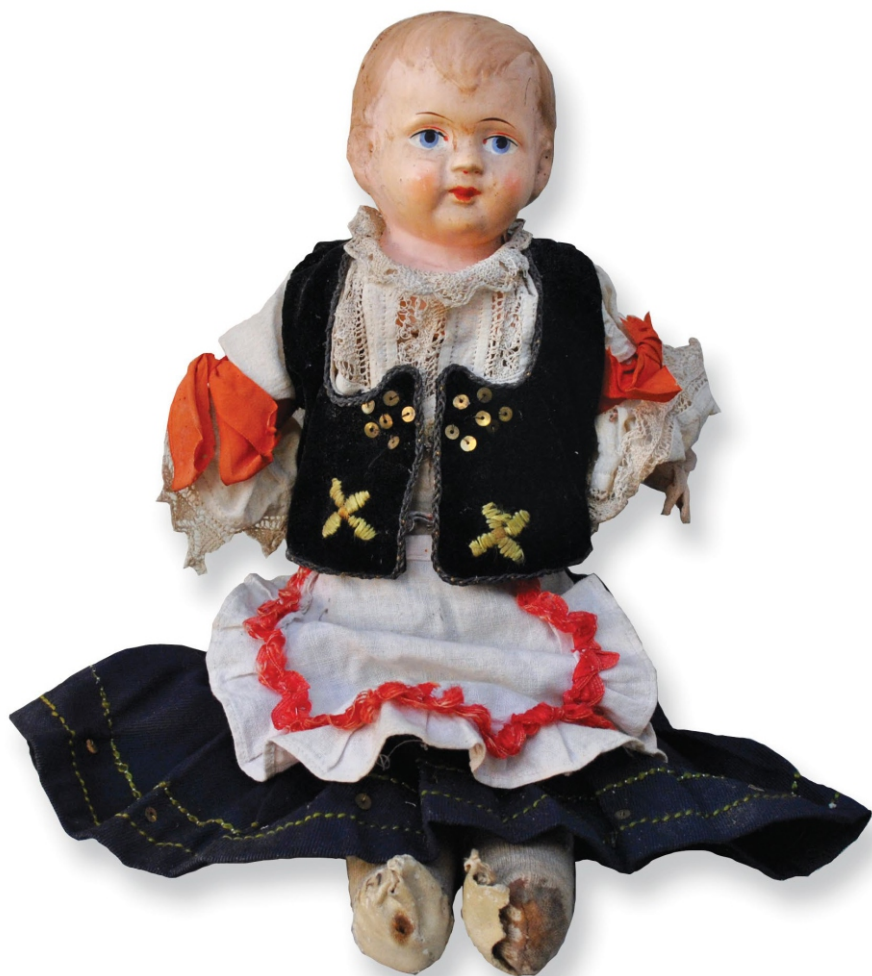
Лутка, XX век МКН, инв. бр.47