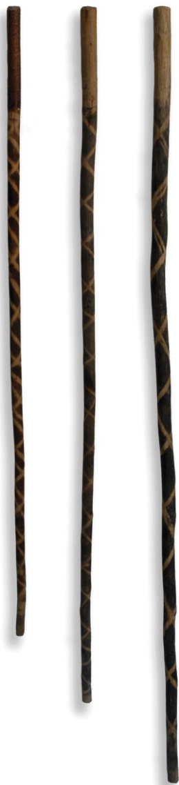
Сл. 2: штапови, XX век МКН, инв. бр. 44, 45, 46

дечје потребе у процесу одрастања и социјализације као што су: срећа, радост, утеха, сигурност, отклања страх, чини дете психички мирним и задовољним.