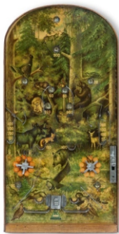
Сл. 1: флипер-дечија играчка Зајечар, 1920. год. НМЗ ЕЗ инв. бр. 2705

Поред дрвеног флипера из 1920. године (сл. 1), ручно направљеног металног митраљеза из 1935. године (сл. 2), посебно место заузимају и текстилни гуштер (сл. 3) из педесетих година прошлог века, гумене играчке седамдесетих и осамдесетих, пластика и Супер хероји деведесетих година XX века као и друштвене игре Монопол и Не љути се човече , уз које се деца и данас забављају, развијају машту и уче нове ствари.