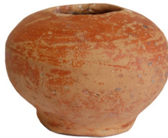
Сл. 6: лоптасти судић, II-III век Локалитет Кеј на Сави на делу јужне некрополе