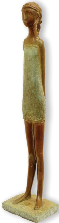
Стојећа фигурина из цикласа ”Игра и раст“ Инв. бр. 494