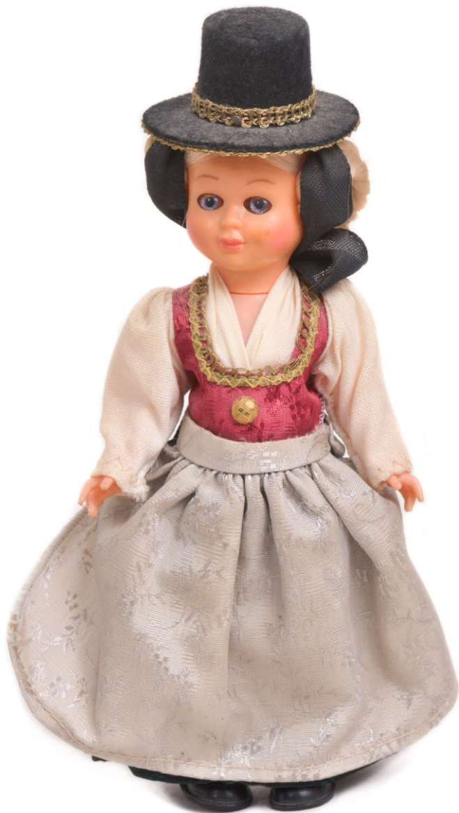
Сл. 6: лутка у ношњи, XX век ЗМК Е3340