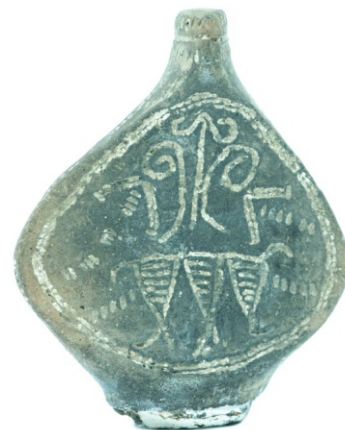
Сл. 4: фрагментована антропоморфна фигурина, средње бронзано доба, дубовачко-жутобрдска културна група

Из праисторијске збирке већину одабраних предмета чине антропоморфне фигурине (жена) из времена неолита (сл. 2, 3) и бронзаног доба (дубовачко-жутобрдска културна група: кат. бр. 52-56, сл. 4). Када говоримо о праисторијским фигуринама жена, почев још од чувене палеолитске Вилендорфске Венере, уз њихову превасходно сакрално-ритуалну намену, треба додати и димензију дечјих играчака. С тим у вези, треба имати у виду да су у неким приликама сакралне фигурине и други предмети коришћени у различитим религијским обредима накнадно поклањани деци да се њима играју.