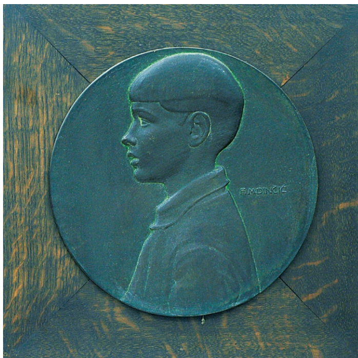
Дечак (плакета) Инв. бр. 423