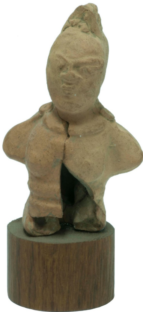
Сл. 1: статуета од теракоте-борац у арени (рвач) II-III век, Рготина