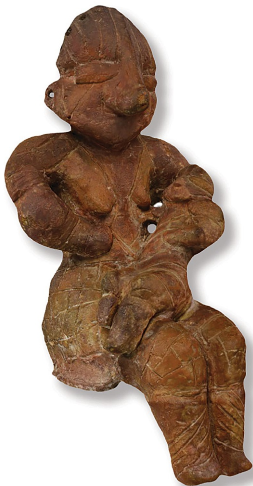
Куротрофна фигурина - Мајка с дететом млађи неолит, винчанска култура (5200-4200 г.пре.н.е.) лок. Слатина - Турска чесма, Дреновац, Параћин

Један од најлепших и најзначајнијих експоната из Завичајног музеја Јагодина, фигурина која представља "свети чин" дојења и сведочи да је однос мајке и детета имао посебан значај за неолитског човека