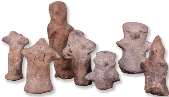
Сл. 2: антропоморфне фигуристине винчанске културе