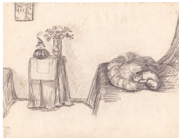
У ентеријеру, око 1960. Инв. бр. 957