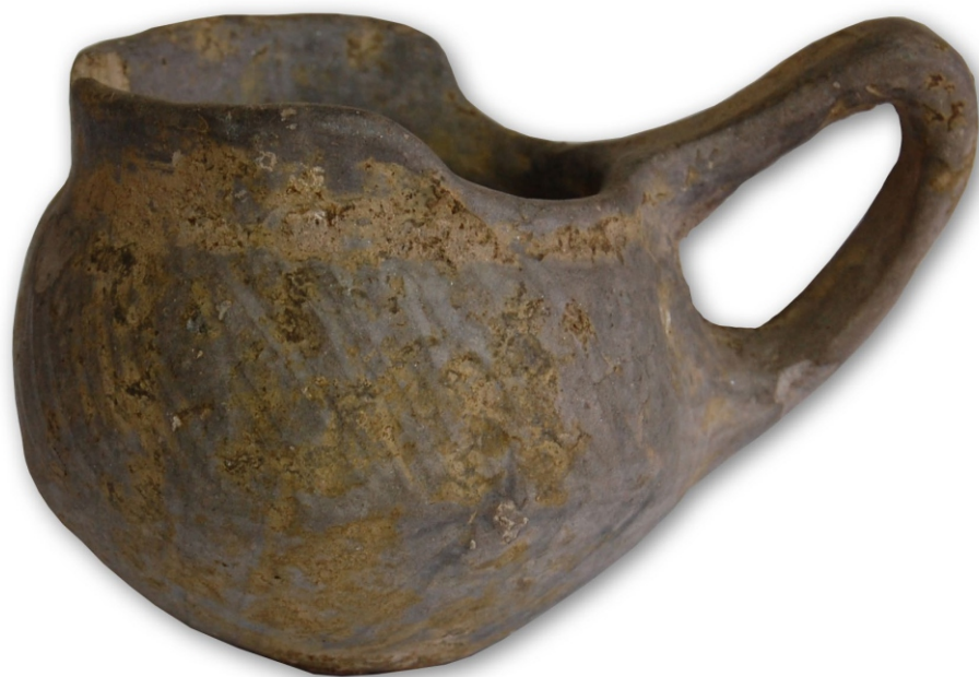
Сл. 1: Судић-шоља, I век Локалитет 49 Сирмијума, инв. бр. 118