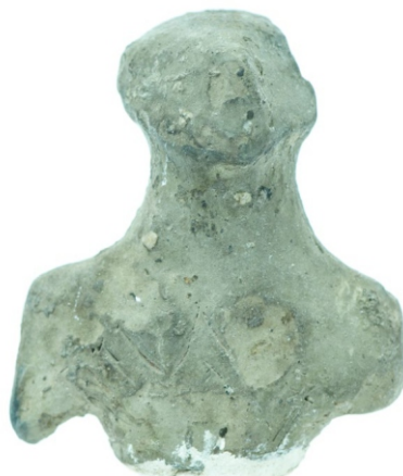
Сл. 3: антропоморфна фигурина неолит (Винча-Плочник)