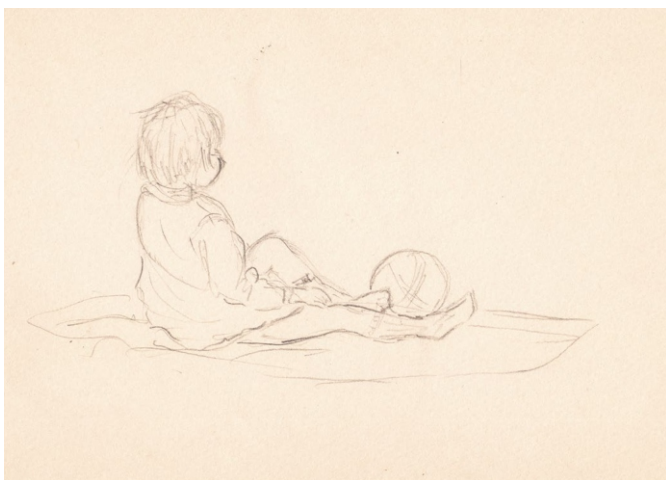
Скица детета са лоптом, 1960. Инв. бр. 956