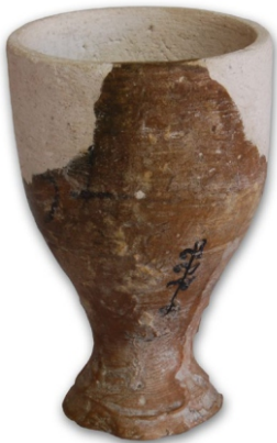
Сл. 5: суд, I век Источна некропола Сирмијума (Нова Циглана)