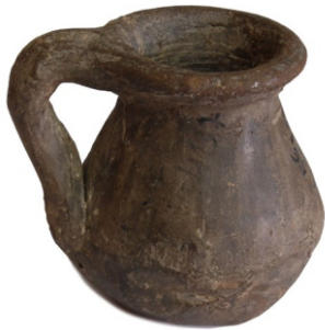
Сл. 7: Минијатурни крчаг, прва половина I века западни бедем и северозападна некропола Сирмијума, локалитет 56