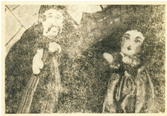
Из једне луткарске представе, Лист "Тимок", 1956.