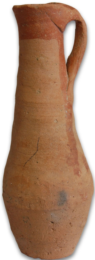
Сл. 8: Суд, II-III век Локалитет 49 Сирмијума

Четврту категорију налаза чине астрагалоидне (зглобне) кости 1 овце или козе за игру tali . Мада је налаз ових костију бројан, у Сирмијуму никада није поуздано документовано да су у питању дечје играчке. Од 2002. године детаљно се прикупља и обрађује археолошки материјал са локалитета Сирмијума и до сада се није посебно обрађала пажња на контекст налаза ових костију које су коришћене у игри сличној игри пиљака.