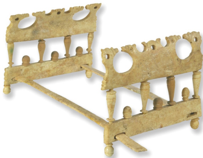
Сл. 1: креветац, II век

животиња, минијатурне посуде, колица- ваљак, коцкице за игру, жетони, астрагали и касе. Приликом тумачења налаза из гробова морамо бити опрезни јер је често тешко одредити шта је вотивна понуда, а шта је играчка. 9 На сложеност овог феномена указује и минијатурни коштани креветац из Виминацијума (сл. 3). Откривен је у гробу девојчице/младе девојке из II века. Израђен је као верна копија или модел кревета чије димензије указују да је реч о играчки. Међутим, у фунералном контексту, као вотивни предмет, минијатурни креветац је иницијацијски симбол који везује детињство и зрело доба. 10