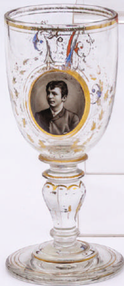
Кат. бр. 39