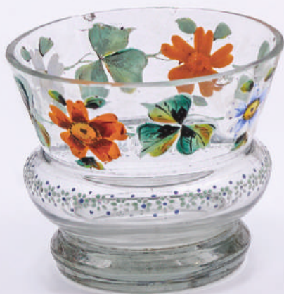
Кат. бр. 44