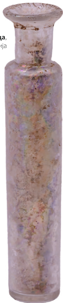
Кат.бр. 24 Бочица, 17 - 18. век, манастир Манасија

стаклених предмета на територији Србије почев од средине 3. века, у нестабилним политичким приликама током 4. века долази до наглог процвата домаће стакларске производње. 7 Упркос бројности, временом квалитет производа из локалних радионица почиње да опада, стакло постаје замућено, мехурасте структуре, у смирај антике најчешће жућкасто – зеленкастих тонова. 8