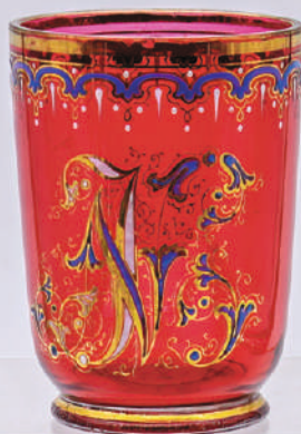
Кат. бр. 40