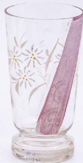
Кат. бр. 45