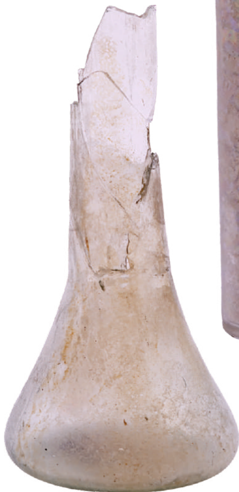
Кат. бр. 1 Тоалетна бочица - балсамариј, 3-4. век, Horreum Margi

Технолошки поступак израде римског стакла 11 започињао је мешањем силиката (кварцног песка) и алкалне супстанце неопходне за његово топљење – соде или поташе, у размери 9:3. Смеса је најпре загревана у земљаним посудама, чиме су одстрањиване нечистоће и пена. Добијена житка маса, стаклача, хлађена је, потом дробљена, а само њени најквалитетнији делови ишли су на даљу обраду, у стакларску пећ, где су топљени на температури до 1300 степени. 12 Тако добијено житко стакло обликовано је неком од стакларских техника које су се развијале, мењале, али и очувале до данашњих дана. Најстарија техника тзв. „пешчаног