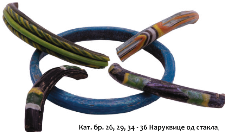
Кат. бр. 26, 29, 34 - 36 Наруквице од стакла, манастир Манасија, 16-17.век

Напоследку, збирка садржи и бројне примерке средњовековног накита од стакла, нарочито наруквица од стаклене пасте. Ова врста накита била је нарочито омиљена на просторима централног и источног Балкана током 12. века, 15 а њено порекло сеже до самих почетака египатског стакларства средином 2. миленијума п.н.е. Осим у источним областима Медитерана, нарукнице од стакла се на европском тлу јављају почев од протоисторијске латенске културе Келта, а у ширу употребу улазе крајем римске Републике, са почетком Римског Царства. 16 Честе на територији под византијским утицајем током 12. века, ове нарукнице нестају са наших простора након повлачења Византије све до турских освајања, када се у већем броју јављају од краја 15. па све до 17. века. 17 Најстарији примерак ове врсте накита у збирци потиче са рановизантијског утврђења у Војсци, а неколико случајних налаза израђених од тамнозеленог и црног непрозирног стакла датују се у 12. век. 18 Знатно је већи број позносредњовековних наруквица из манастира Манасија, које одликује изразит сјај, због новина у технологији израде у односу на старије епохе. Њихово присуство доводи се у везу са падом Манасије у турске руке, што истраживачи виде као потврду оријенталног порекла ове врсте накита и традиције његове израде у области источног Медитерана. 19