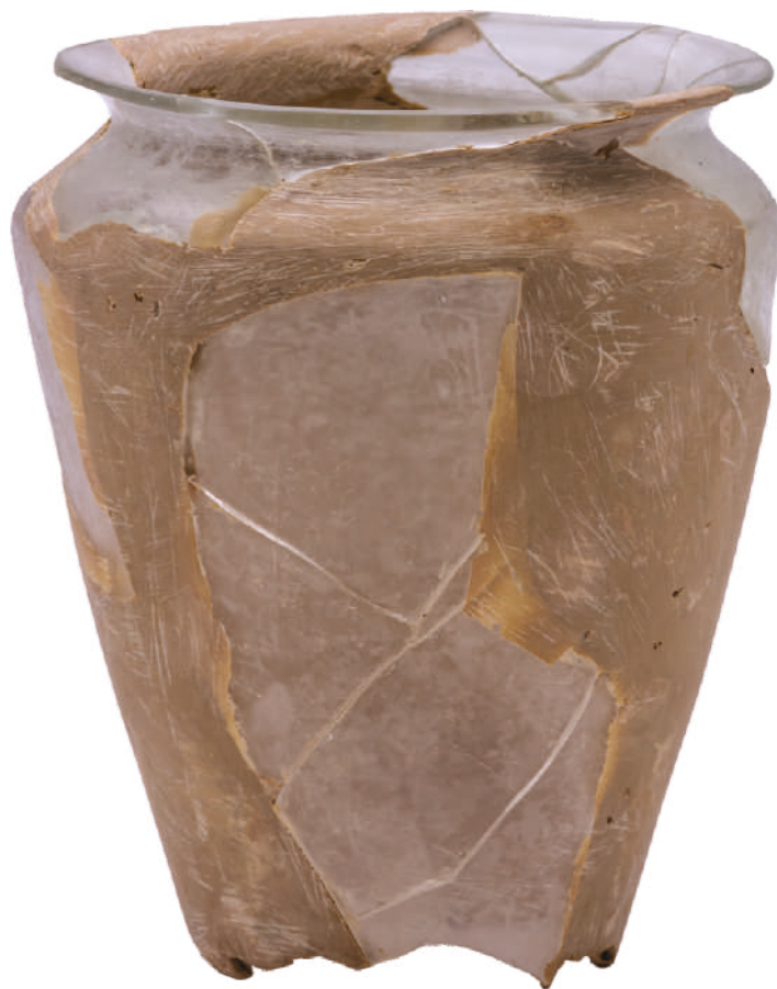
Кат.бр.22 Кандило, 15. век, манастир Манасија

Највећи број средњовековних налаза од стакла у нашим збиркама потиче са систематских археолошких истраживања манастира Ресава