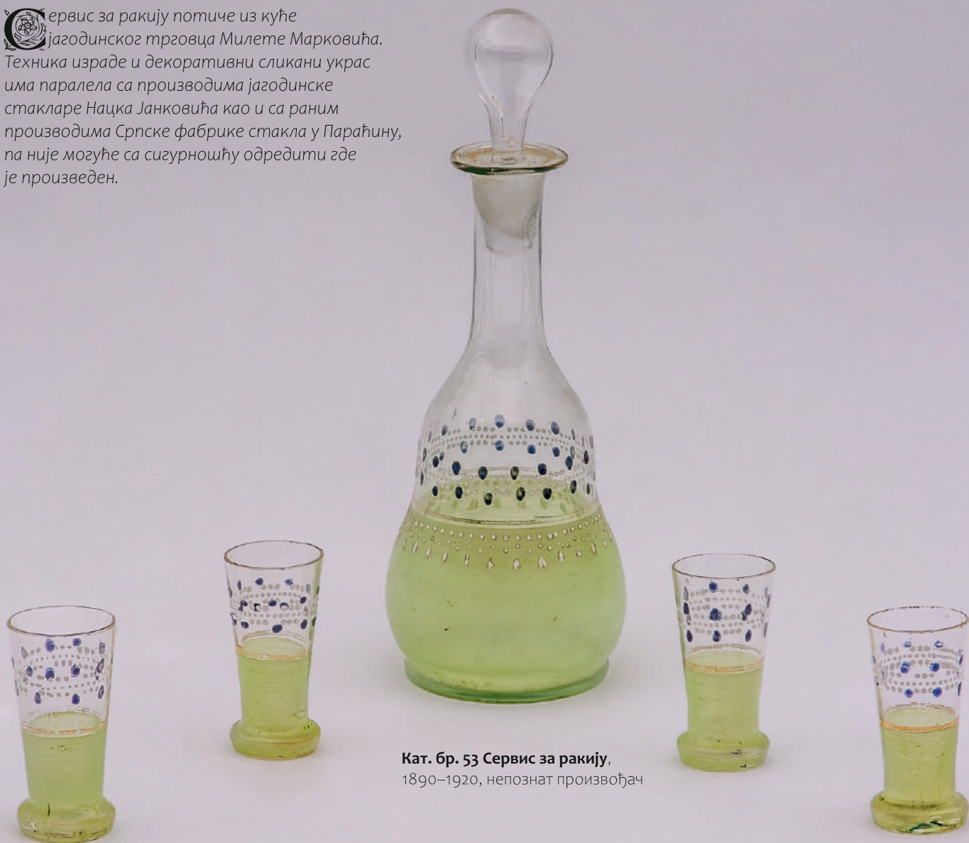
Кат. бр. 53 Сервис за ракију, 1890–1920, непознат произвођач