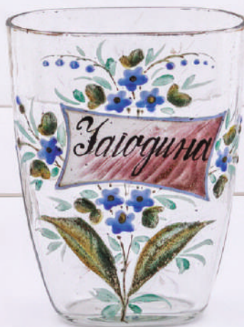
Кат. бр. 43